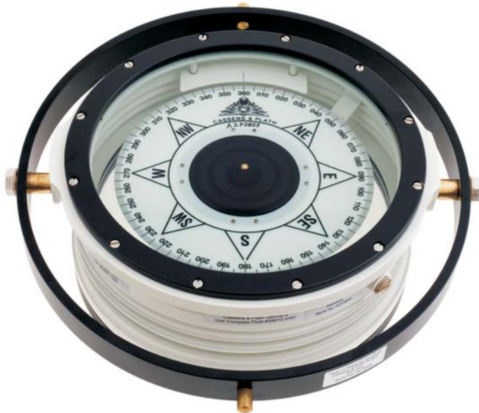
Steering compass Type/11 Steuer-Kompass Type/11