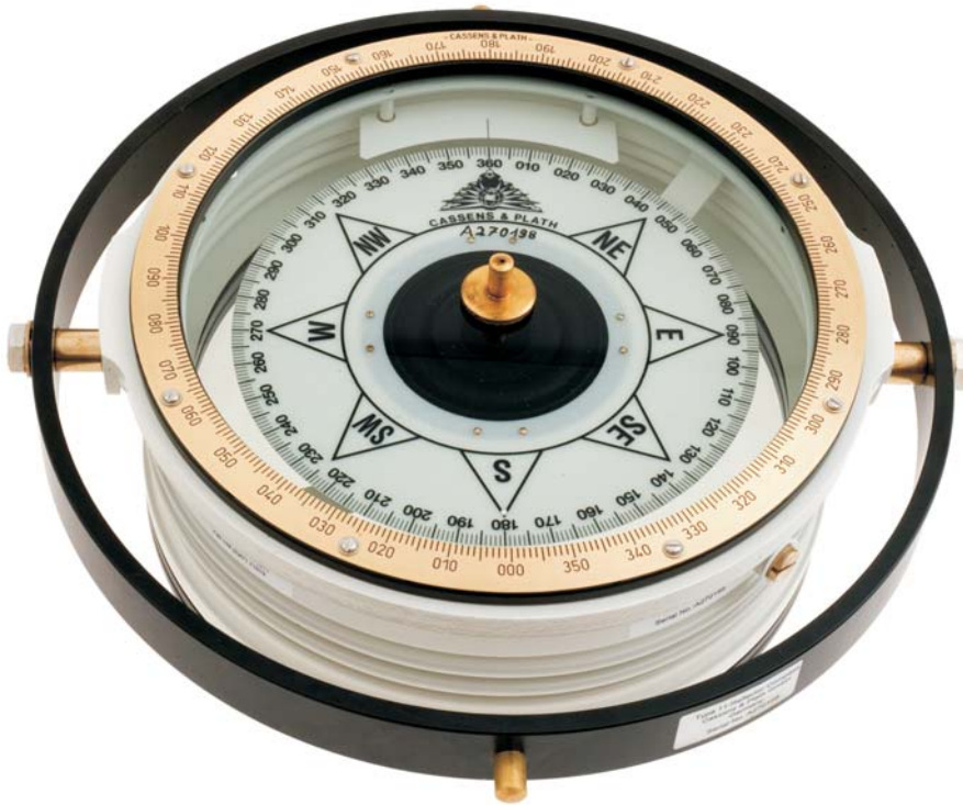
Reflector/Bearing compass Type/11 with graduated verge ring and centre pivot for bearings Peil-/Reflexions-Kompasse Type/11 mit Grading und Zentrumstück für Peilungen